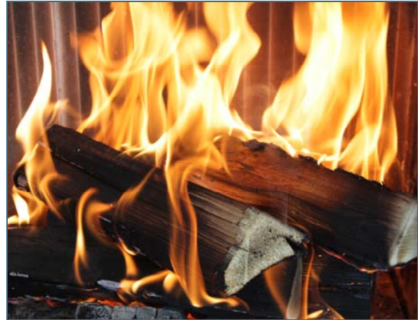
Abb. 9: Verbrennungsluftzufuhr vermindern, sobald der Verbrennungsvorgang in Gang gekommen ist.