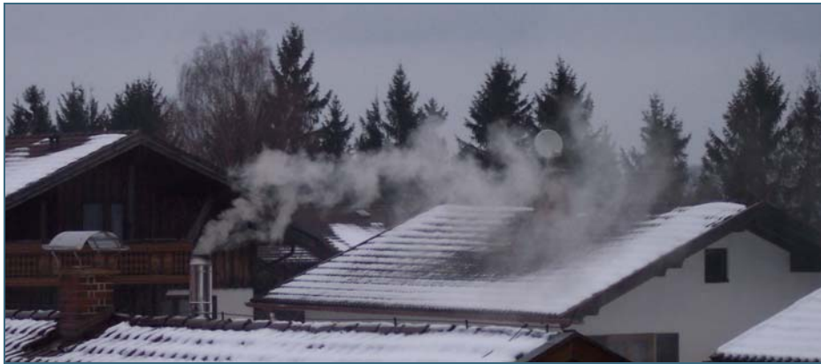
Abb. 1: Holzöfen können den Gehalt an Feinstaub in der Umwelt enorm erhöhen – vor allem wenn ältere Anlagen und nicht zugelassene Brennstoffe verwendet werden.

Ob der Feinstaub in der Luft aus Holzfeuerungen stammt, lässt sich anhand des Kalium-Gehalts im Feinstaub ermitteln. Kalium ist in Holz in relativ hohen Konzentrationen enthalten, dagegen kaum in Benzin, Heizöl und Gas. Das im Gesamtfeinstaub enthaltene Kalium stammt daher überwiegend aus der Holzverbrennung.