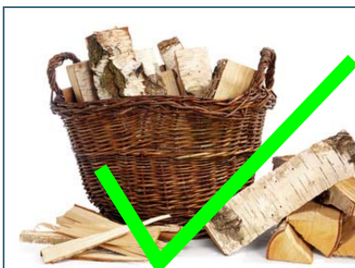
Abb. 5: In Kaminöfen dürfen nur naturbelassenes Scheitholz oder daraus hergestellte Briketts verbrannt werden.

Die für Kaminöfen zugelassenen Brennstoffe sind in der Bedienungsanleitung des Herstellers genannt. Altholz und Rindenbriketts dürfen in Kaminöfen nicht verbrannt werden.