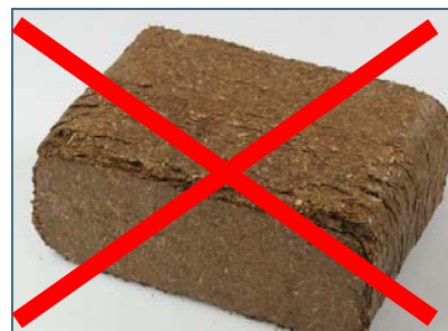
Abb. 7: Auch Rindenbriketts dürfen in Kaminöfen nicht verbrannt werden, der hohe Gehalt an Salzen führt zu sehr hohen Staubemissionen.