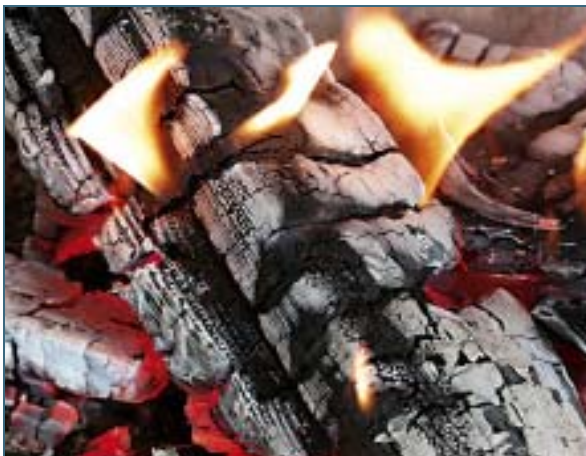
Abb. 9: Kurz bevor die Flamme erlischt, ist der richtige Zeitpunkt zum Nachlegen.

In Kaminöfen wird häufiger eine kleine Brennstoffmenge nachgelegt. Es gilt: je Kilowatt (kW) Nennwärmeleistung halbstündlich 0,15 kg Holz. Die Scheite sollten waagrecht und mit der Spaltkante nach unten oder zur Seite auf das Glutbett gelegt werden.