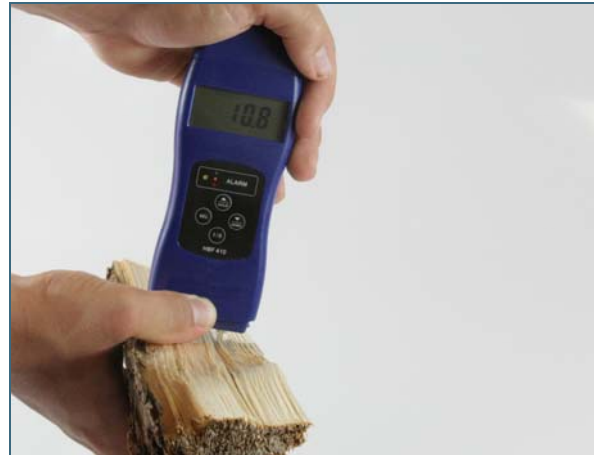
Abb. 4: Brennholz muss trocken sein: Es darf maximal 25 Prozent Wasser enthalten.

Verbrennt man Gebrauchtholz, gelangen aus den Lackierungen, Holzschutzmitteln oder Anstrichen umweltschädliche, teils krebserzeugende Stoffe mit dem Abgas in Ihre Nachbarschaft. Nur naturbelassenes Holz kann in Kaminöfen schadstofffrei verbrennen.