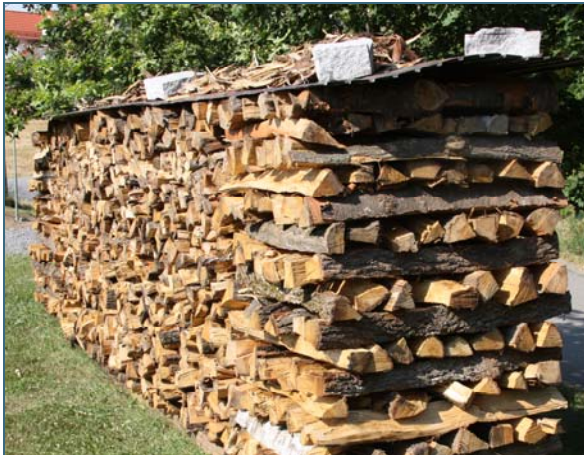
Abb. 3: Vor dem Einsatz muss erntefrisches Holz ein bis zwei Jahre gelagert werden.

Wird feuchtes Holz verbrannt, geht viel Energie für die Verdampfung des im Holz enthaltenen Wassers verloren – und das Feuer wird nicht sehr heiß. Da Holz nur bei ausreichend hohen Temperaturen sauber verbrennt, darf der Feuchtegehalt von Brennholz 25 Prozent nicht überschreiten.