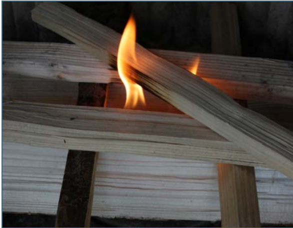
Abb. 8: Wird von oben angeheizt, treten weniger unverbrannte Brenngase aus als wenn von unten angeheizt wird.