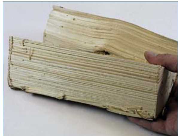
Abb. 10: Für einen 6-kW-Ofen sind 1 kg Fichtenholz jede halbe Stunde optimal, das sind zwei kleine Scheite.