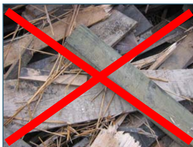
Abb. 6: Altholz darf in Kaminöfen nicht verbrannt werden, es enthält zu viele Schadstoffe.