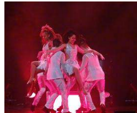
Was für eine Hammershow- Night of the Dance begeistert im... von Thomas Rank