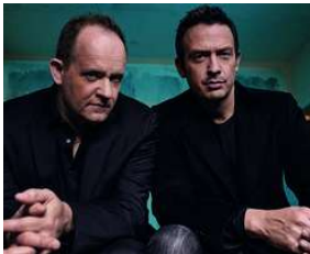
Nightfall Tour – Till Brönner und Dieter Ilg am 18. Januar...