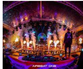
AIRBEAT ONE Festival 2020 – Line Up Phase 1-David Guetta... von Thomas Rank